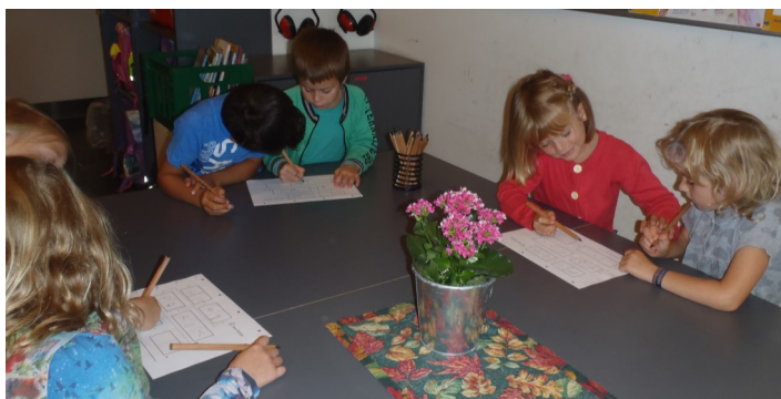
Makkerparrene snakker sammen om løsningerne.