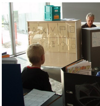
Lydene laves to gange.