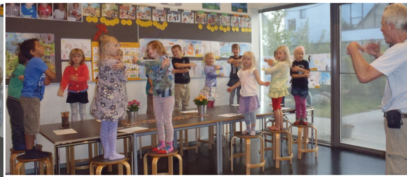
Kommapause, hvor børnene laver fysiske øvelser.